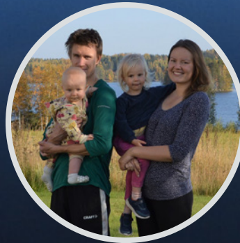
Timosen perhe muutti Hokkaan