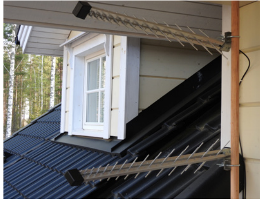
4G-reitittimeen kytketty kaksoisantenni omakotitalon parvekkeella Ukonniemessä.

Puhelinyhtiöiden voimakkaasta mainostuksesta huolimatta 5G:n giga-luokan mobiiliverkkonopeuksia maaseudulla ei nähdä vielä vuosiin. Hokassa voi tavoitella 30...100 megatavun/s nopeusluokkaa; joissain paikoissa 100...300