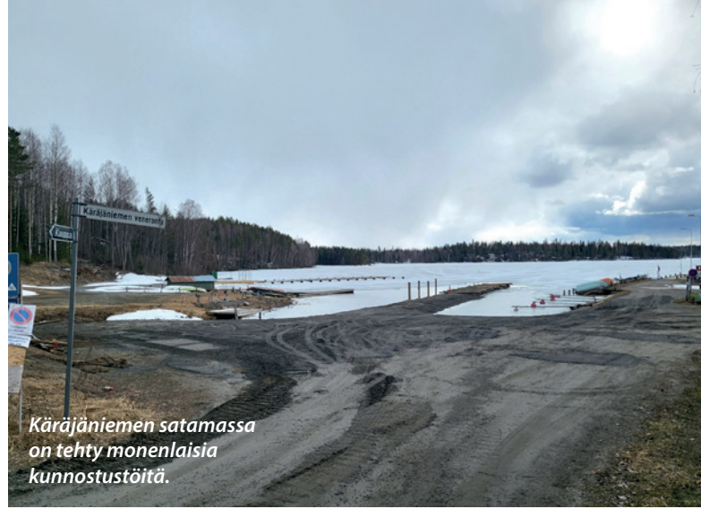
Käräjaniemen satamassa on tehty monenlaisia kunnostustöitä.

- Liikennettä riittää. Uudelle parkkipaikalle mahtuu noin seitsemänkymmentä autoa edellyttäen, että ne on oikein parkkeerattu. Trailerit tulee sijoittaa ohjeen mukaan sivuun