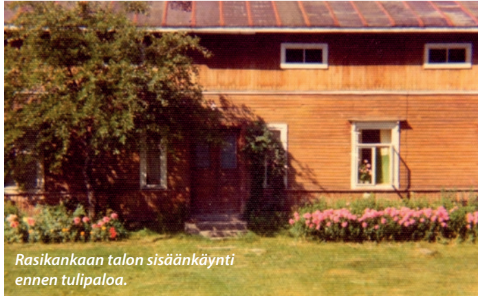
Rasikankaan talon sisäänkäynti ennen tulipaloa.

MAALAISTALOSSA lastenkin piti tehdä varsinkin kesäisin töitä osaamisen ja jaksamisen mukaan. Ei-niin-hyviä hommia olivat kivien keruu viljapelloil-